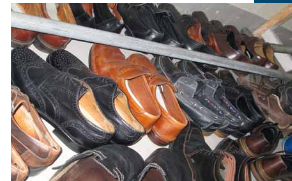
Gutes Schuhwerk wird immer gebraucht.