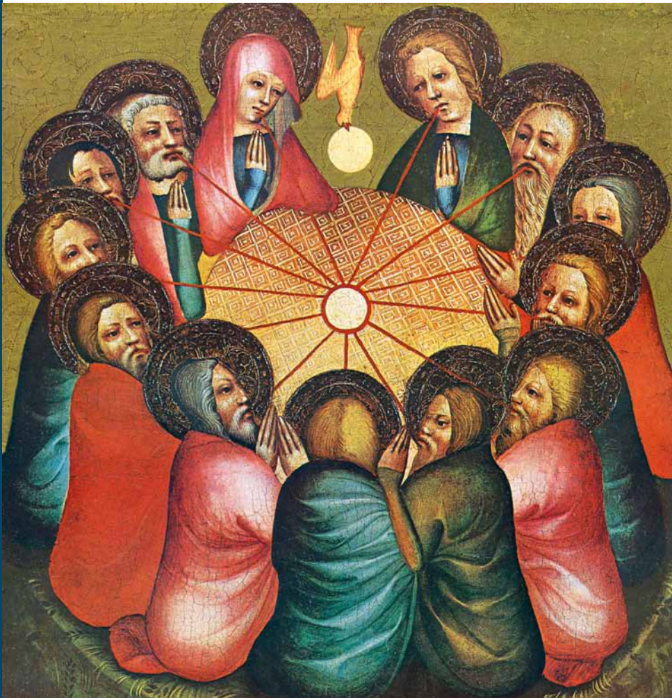
Pfingstbild des Osnabrücker Altars von 1370/1380 (ausgestellt im Kölner Walraf-Richarz-Museum)

einer Rasenbank sitzen: Eine konzentrierte Tischrunde. Den Mittelpunkt des Tisches bildet eine kleine reinweiße Scheibe, eine Abendmahls-Oblate. Dieser Mittelpunkt und die verschiedenen Kreisformen bestimmen das Bild. Die Bank ist rund, die Heiligenscheine zeigen die Rundform, die Jünger und Maria sitzen um einen runden Tisch. Ihr dichtes Zusammensein drückt aus, wie sehr sie aneinander festhalten.